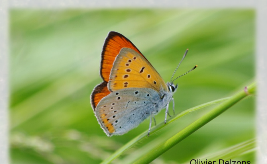
Cuivré des marais, espèce patrimoniale présente sur le site