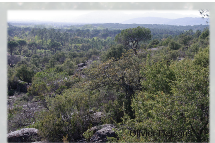
Suivi d'un site de 800 ha dans la plaine des Maures (dont 50 ha très anthropisés)