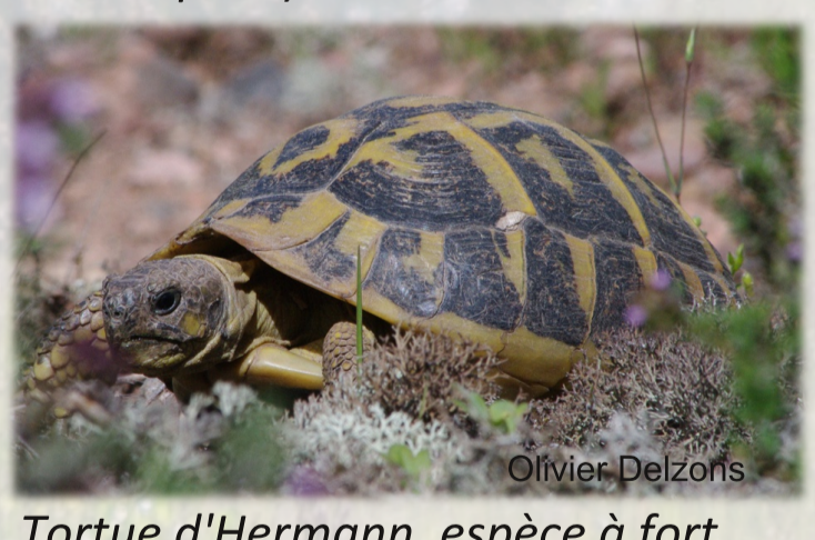
Tortue d'Hermann, espèce à fort enjeu suivie sur le site